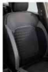
Asientos de tela con detalles tipo piel