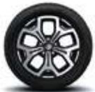
Rin aluminio bitono de 17" (Iconic CVT)