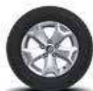
Rin aluminio de 16" (Intens TM)